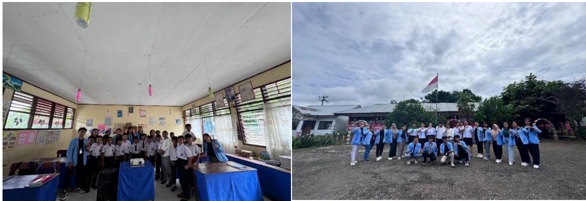
Gambar 1. Pelaksanaan Penyuluhan 6 langkah

Peningkatan pengetahuan siswa tentang cuci tangan enam langkah menunjukkan bahwa penyuluhan kesehatan yang dilakukan efektif dalam mencapai tujuannya. Hasil ini sejalan dengan penelitian sebelumnya yang menunjukkan bahwa edukasi yang tepat dapat meningkatkan pengetahuan dan praktik kesehatan di kalangan anak-anak.